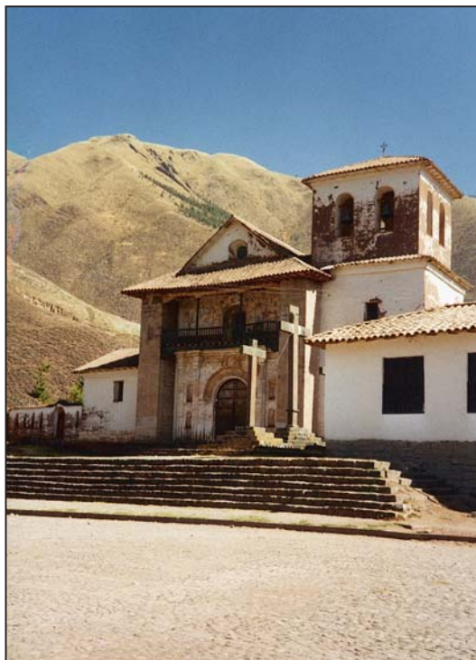
Andabuyllillas tiene una plaza con una antigua iglesia de yeso blanco, y adobes hechos —quizás— con el polvo de los Incas

correa de cuero alrededor de su cintura, sujeto a un poncho a medio hacer al otro extremo de un árbol de eucalipto grande y viejo. Los colores brillantes de los hilos eran rojo, púrpura y amarillo. Con rapidez y destreza, movía sus herramientas de hueso entre las hebras verticales de lana de llama, mientras cruzaba otro hilo horizontalmente. Luego, con una espátula de hueso, de un color blanco-amarillento, templaba las hebras de hilo, como si fueran las cuerdas de un arpa. Se le veía anciano y experimentado, en comparación con las otras gentes del lugar, olía a coca —la que es masticada por la mayoría de ellos— vagamente, y a aguardiente, casi como si quisiera ocultarlo.