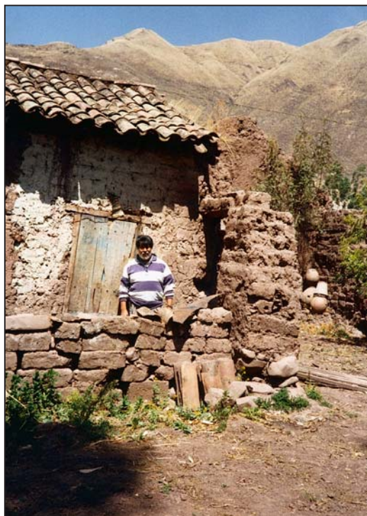
La casa de adobe de mi abuelo, con vigas de madera de eucalipto —visiblemente apolilladas y podridas— que la sostuvieron quién sabe por cuántos años.

Así, en su estado semicomatoso, el alma del Cóndor regresa a ese niño de cinco años, que va por primera vez a la escuela con su tío, de mestizaje más moreno y mayor que él. No usa zapatos y sus pies son duros y fuertes como las garras de un cóndor. Él pisa las piedras punzantes sin sentir dolor. Cóndor, que usa zapatos, le pregunta: ¿Por qué